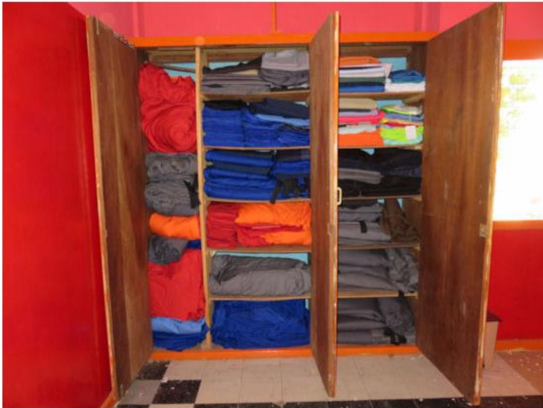
In het nieuwe pand. Alle losse stoffen keurig opgevouwen in een van de vele kasten die de nieuwe werkplaats rijk is...