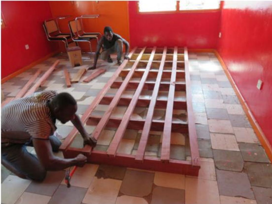
In het nieuwe pand. Een vlinder maken zodat de rollen stof straks vrij van de grond liggen.