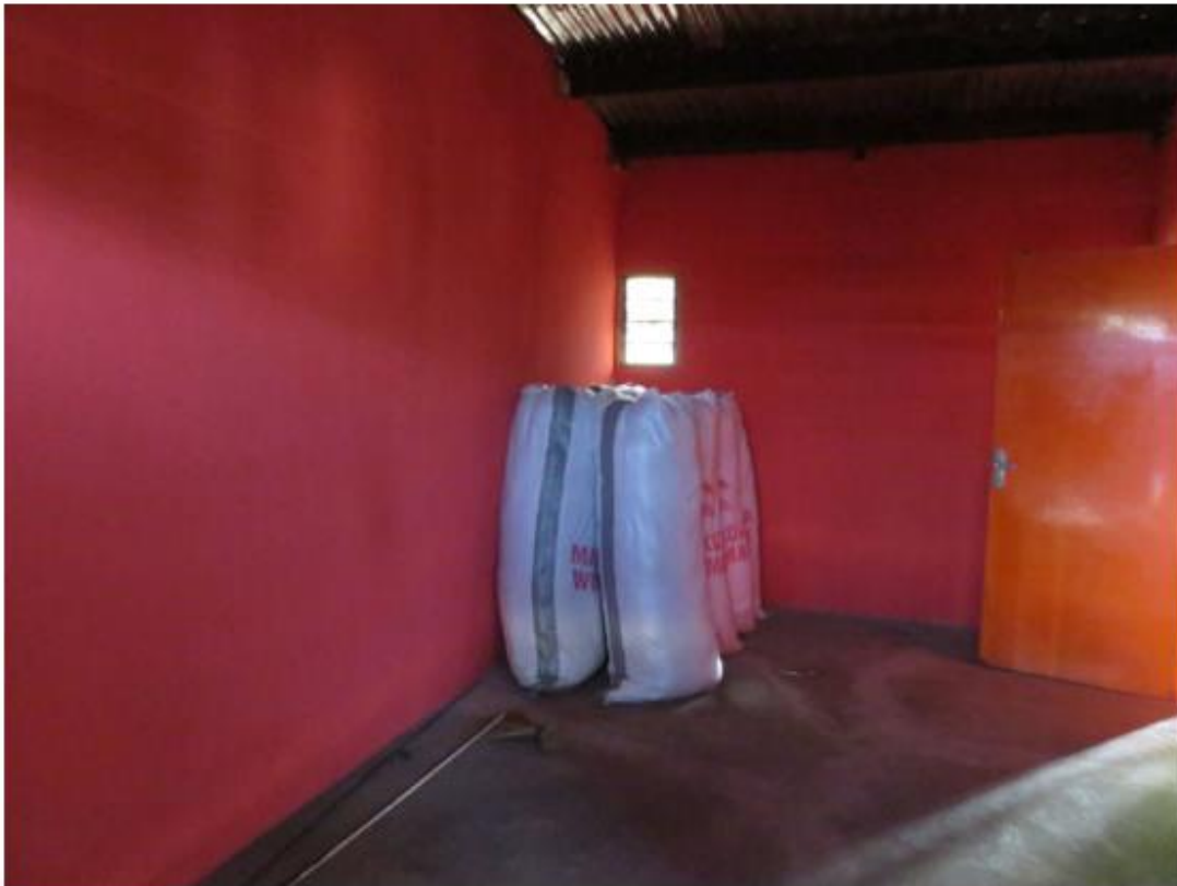
In het nieuwe pand. De schuur is een prima plek om de kant en klare NCB's op te slaan in afwachting van verder transport.