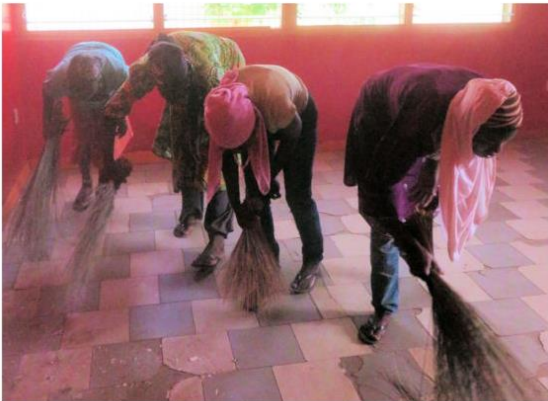
In het nieuwe pand. Goed met de bezem er door heen. Sneller dan stofzuigen!